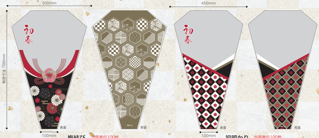
梅結び 出荷単位100枚 94.50円